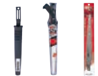
サヤ付き KL-30A KL-30A-1