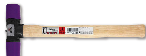
ウレタンハンマー