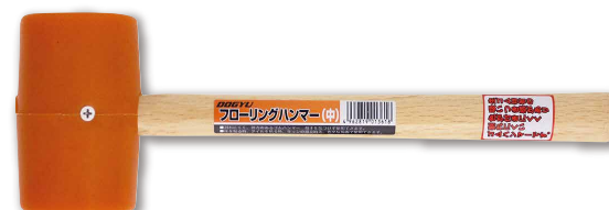
フローリングハンマー