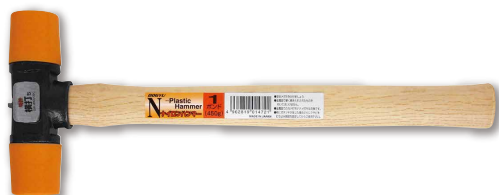
ナイロンハンマー