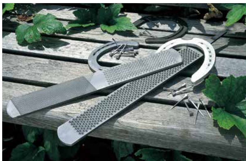
馬蹄ヤスリ HORSE RASPS