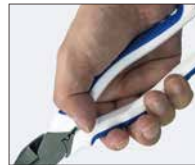
▲ エラストマーグリップ