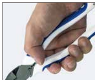
▲ エラストマーグリップ